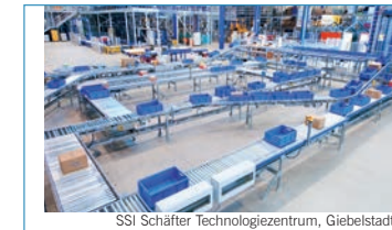
SSI Schäfer Technologiezentrum, Giebelstadt

Der Logistik-Experte SSI Schäfer ist der weltweit führende Anbieter von Lager- und Logistiksystemen. Die Teilnehmer des KÄLTEFORUMS