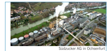
Südzucker AG in Ochsenfurt

Die Südzucker AG ist ein innovatives Unternehmen der Ernährungs-industrie. Besichtigt wird der Produkti-